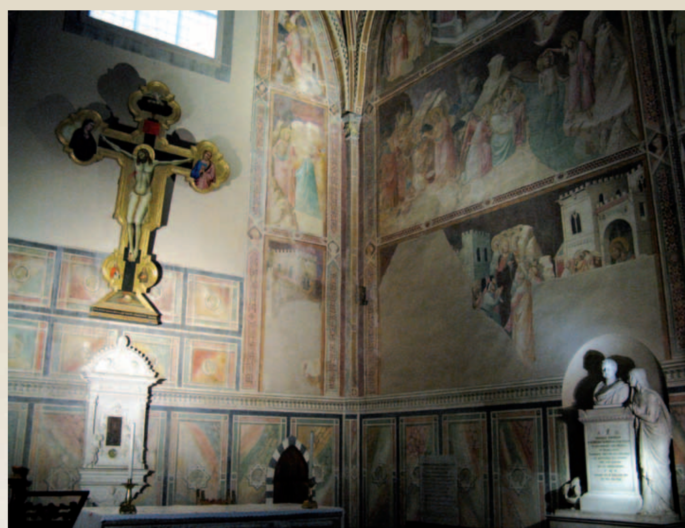
Didinga rintimi dvelkianti Dievo kūno koplyčios erdvė. M. K. Oginskio antkapinis paminklas dešinėje pusėje. Vyto Rutkausko nuotrauka, 2008 m.