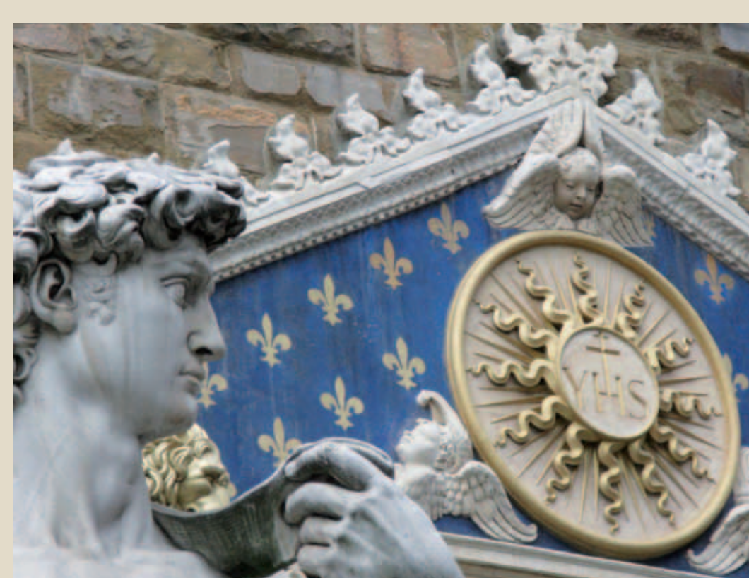
Mikelandželo (t. Michelangelo Buonarroti 1475-1564) skulptūros „Dovydas“ fragmentas. Sinjorijos aikštė, Florencija.

1829 m. pas M. K. Oginskį į Florenciją atvyko poetas Adamas Mickevičius. Jį drauge su kitais bendraminčiais – Vilniaus universiteto auklėtiniais, Filomatų ir Filaretų draugijų nariais – carinės Rusijos valdžia 1823 m. areštavo, o vėliau ištrėmė į nuošalesnes imperijos gubernijas. Galima tik spėlioti apie M. K. Oginskio ir A. Mickevičiaus ilgą vakarajimų nuotaikas, mįslingą pokalbį ir diskusijų turinį. Galimas dalykas, kad jų metu skambėdavo ir naujo Tėvyneje bręstančio suklimo tema. Gali būti, kad siekdamas apsaugoti A. Mickevičiaus gyvybę ir neeilinį talentą, M. K. Oginskis jam patarė tiesiogiai sukilime nedalyvauti.