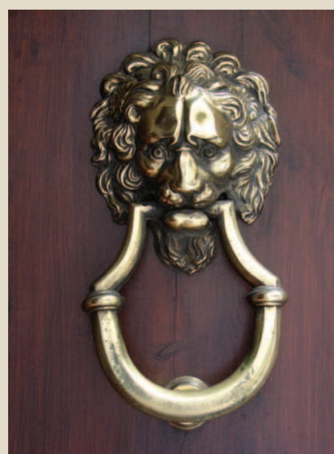
Tornabuoni g., Nr. 10 namo durų belstukas. Vyto Rutkausko nuotrauka, 2008 m.