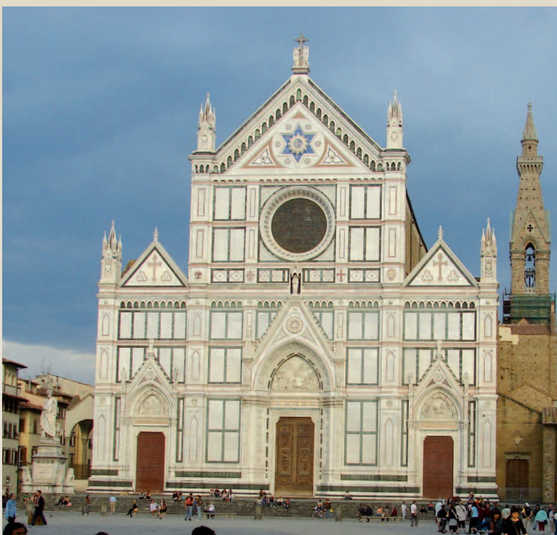
Garbsioji Florencijos Švento Kryžiaus bazilika (Bazilika di Santa Croce) – didžiųjų Europos kultūros puoselėtojų panteonas. Čia ilsisi Leonardo Bruni (1370-1444), Mikelandželo (1475-1564), Galilejus (1564-1642), Džozakino Rosinio (1792-1868) ir daugelio kitų istorinių asmenybių palaikai.