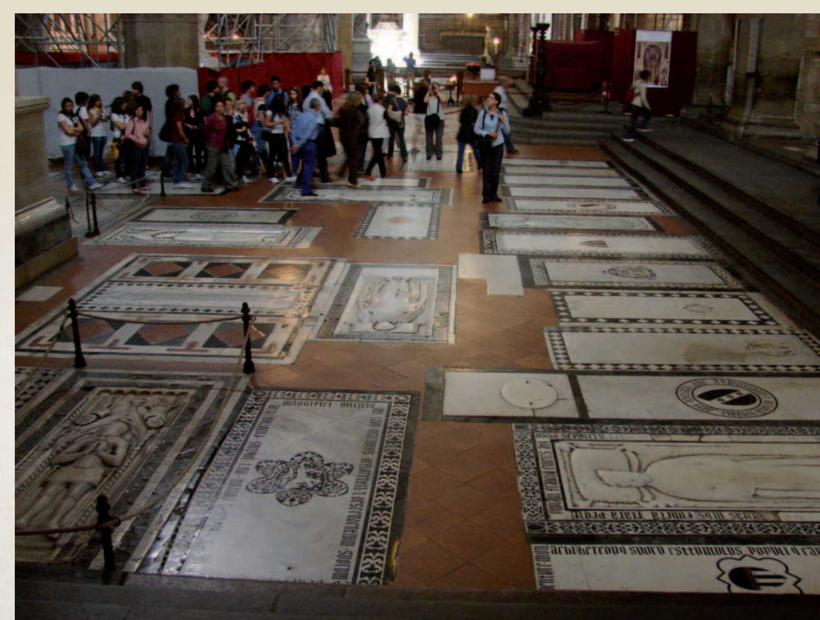
Švento Kryžiaus bazilikoje grindys priešais centrinį altorį padengtos iškilųjų XV-XIX a. asmenybių antkapinėmis plokštimis. Vyto Rutkausko nuotrauka, 2008 m.