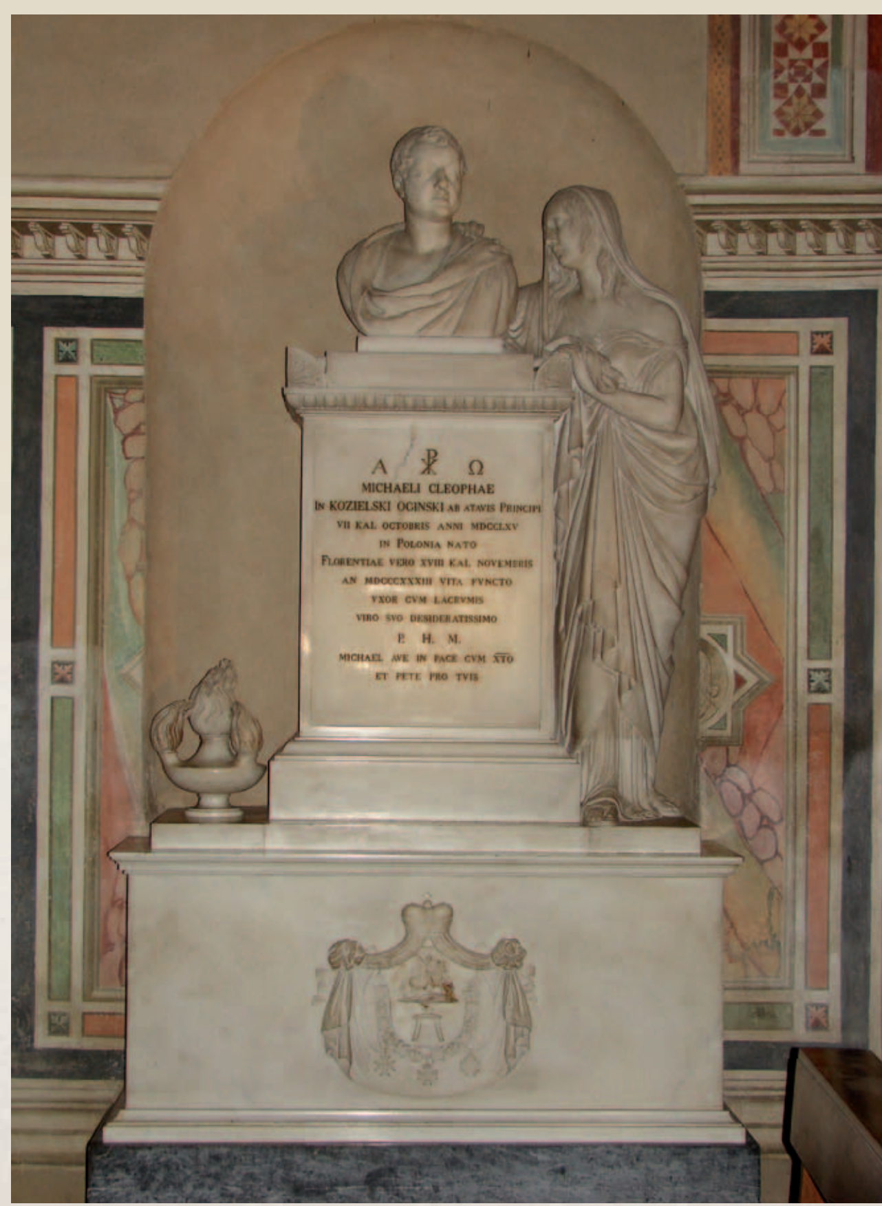
Švento Kryžiaus bazilikos, Dievo kūno koplyčioje (capella Castelliani de Santissimo) baltos marmuro antkapinis paminklas žemklna Mykolo Kleopo Oginskio amžinojo poilsio vieta. 2008 m.