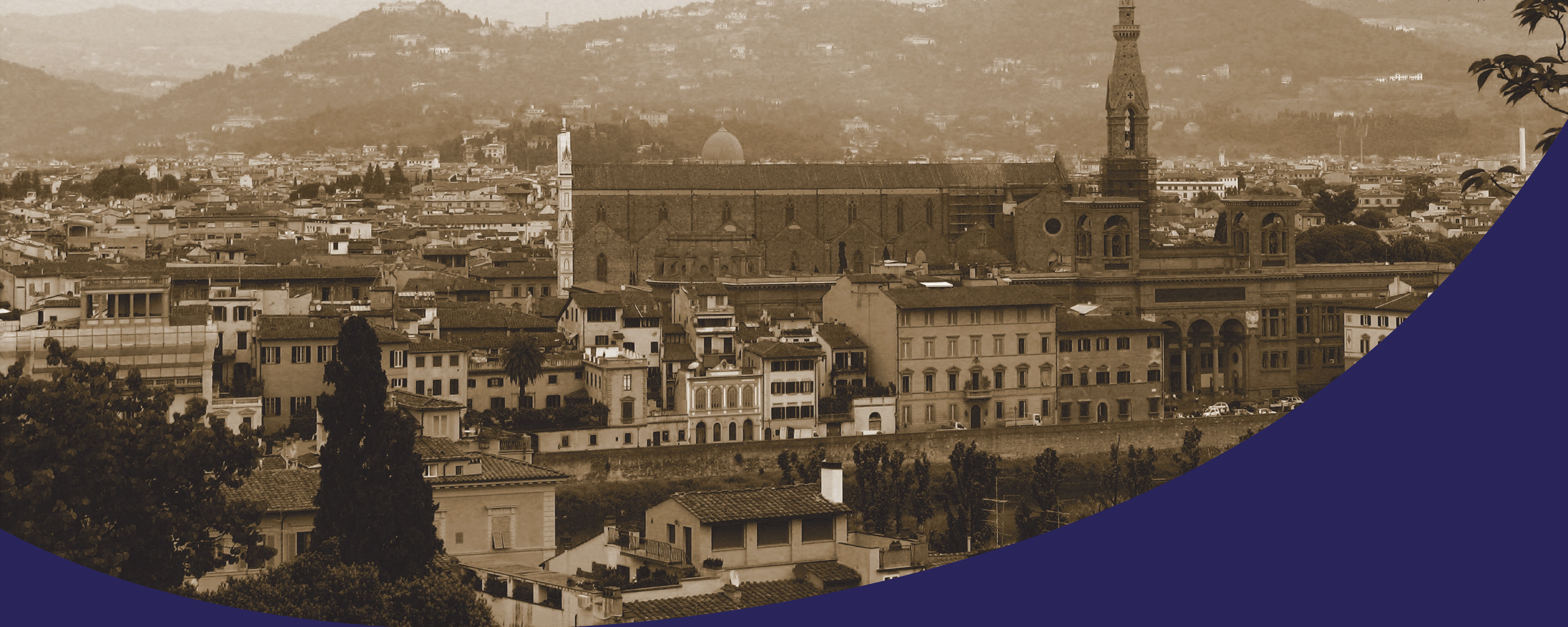
Vaidas į Arno upės ir Švento Kryžiaus bazilikos (Bazilika di Santa Croce) pusę nuo Bardini sodų terasos. Florencija, 2008 m.