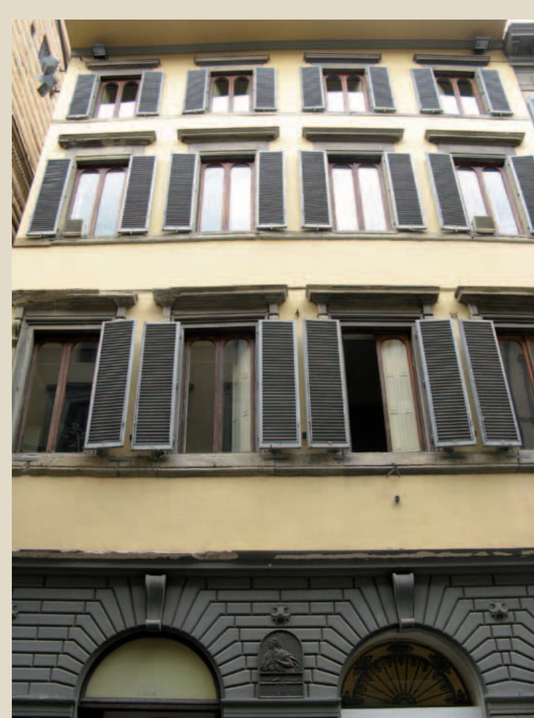
Tornabuoni g., Nr. 10, rūmai kuriuose M. K. Oginskis gyveno paskutiniais gyvenimo metais.