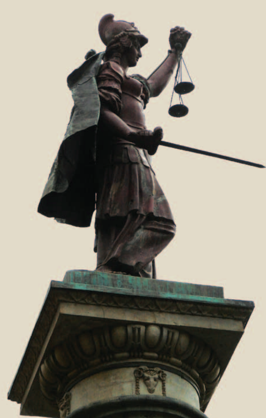
Teisingumo kolonos (Colonna della Giustizia) fragmentas Tornabuoni gatvėje. Vyto Rutkausko nuotrauka, 2008 m.