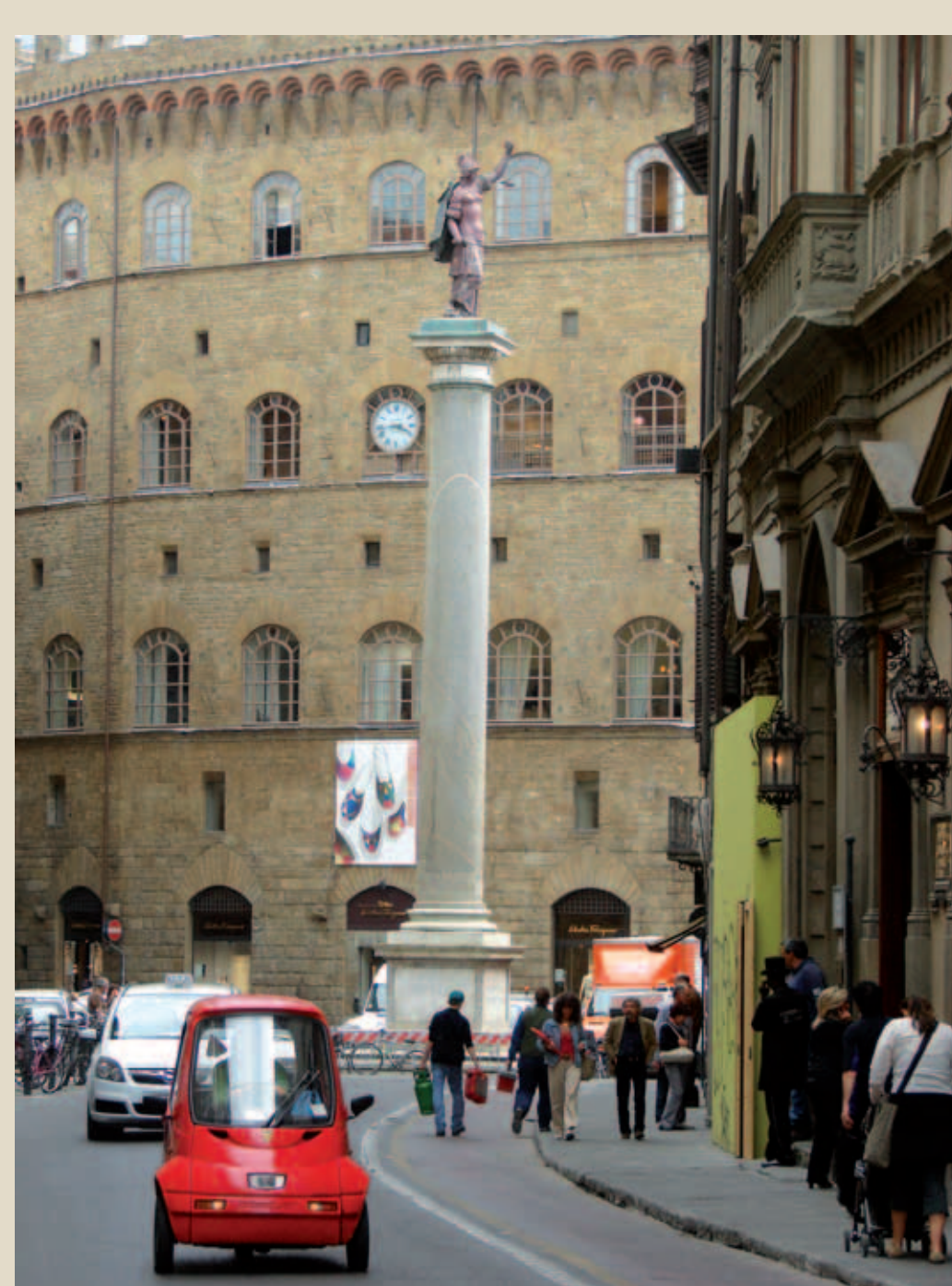
Florencija, Tornabuoni g. žvelgiant nuo Arno upės pusės. Vyto Rutkausko nuotrauka, 2008 m.