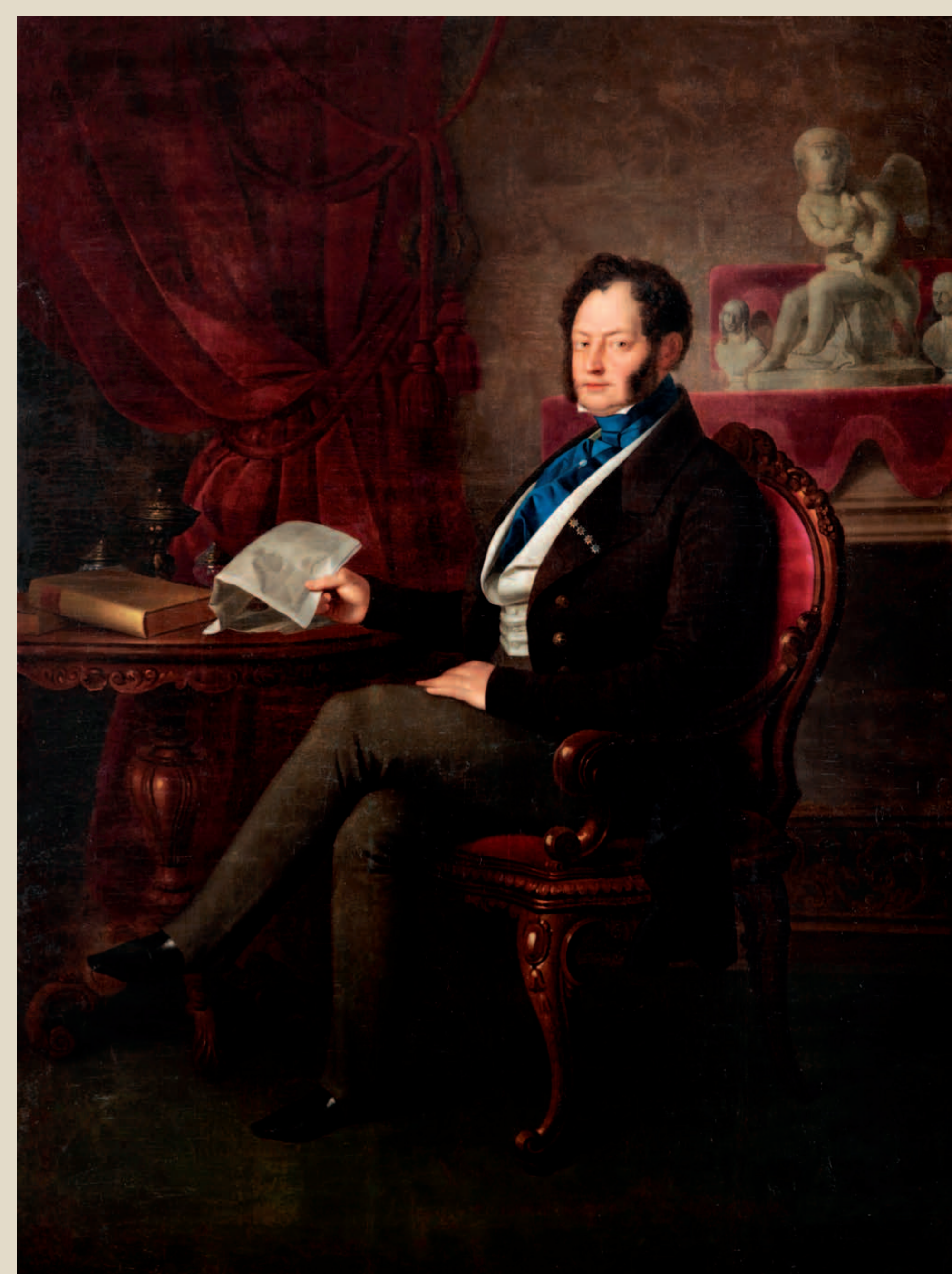
Mykolo Kleopo Oginskio portretas. Dail. Juozapas Olekevičius (1777-1830 m. (3). Drobė, aliejus, 194 x 146,5 cm. Nacionalinis M.K. Čiurlionio dailės muziejus, VM-546. MS-822.

1822 m. prasidėjo paskutinis M. K. Oginskio atsisveikinimo su Tėvyne etapas. Emigranto kelias iš Vilniaus per Varšuvą, Dresdeną, Paryžių vedė į Florenciją. Į miestą-muziejų, kuriame kiekviena aikštė ir gatvė, kiekviena šventovė ar meno galerija dvelkte dvelkia istorinės atminties, didžiųjų pasaulio kultūros koryfejų kūrybinio palikimo dvasia.